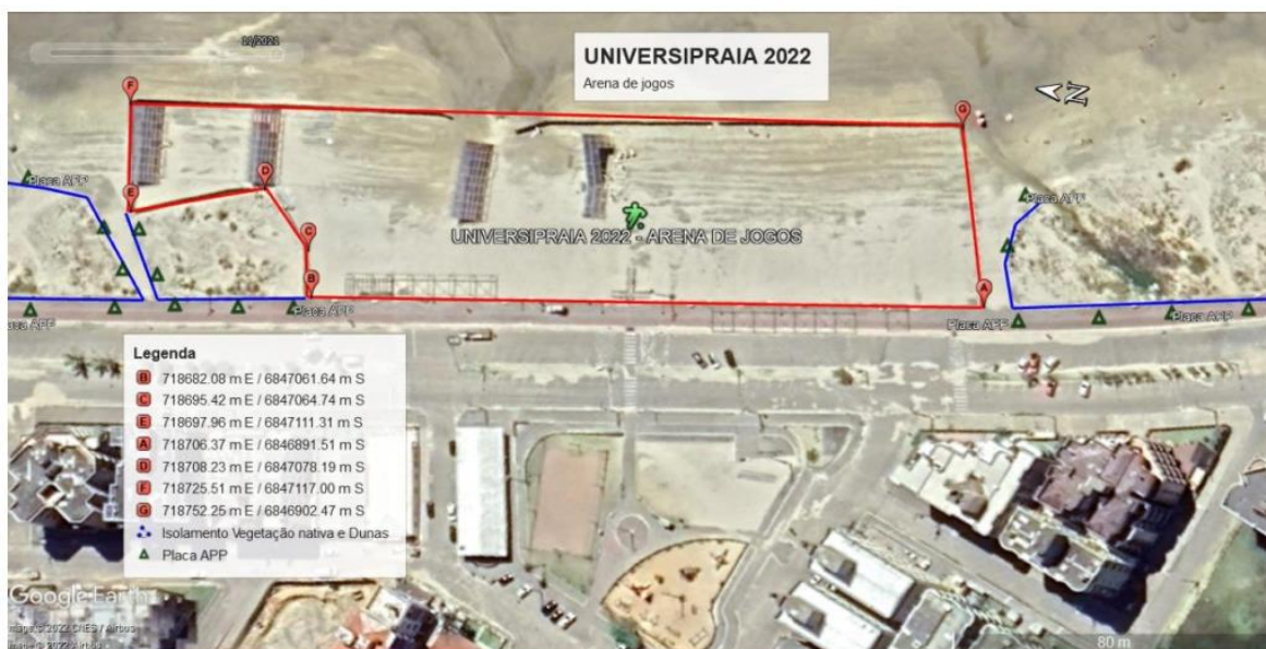
Figura 3: Localização da área de intervenção, conforme indicado pelo requerente.

6.3. Para fins de instrução do atual procedimento administrativo a requerente apresentou os seguintes documentos: