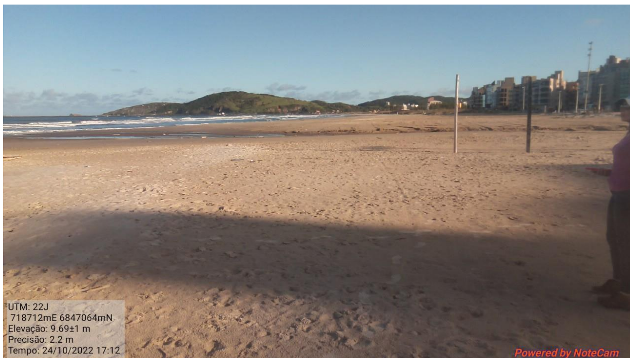
Figura 4: Aspecto da área de intervenção na data da vistoria.

6.9.1. O polígono indicado para as intervenções abrange porção de depósitos arenosos de praia, com declividade baixa e suscetível à ação da dinâmica marinha (Figura 4).