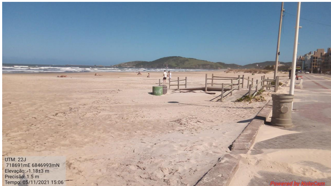
Figura 6: Vista parcial da área de intervenção com destaque para os elementos de infraestrutura urbana existentes.