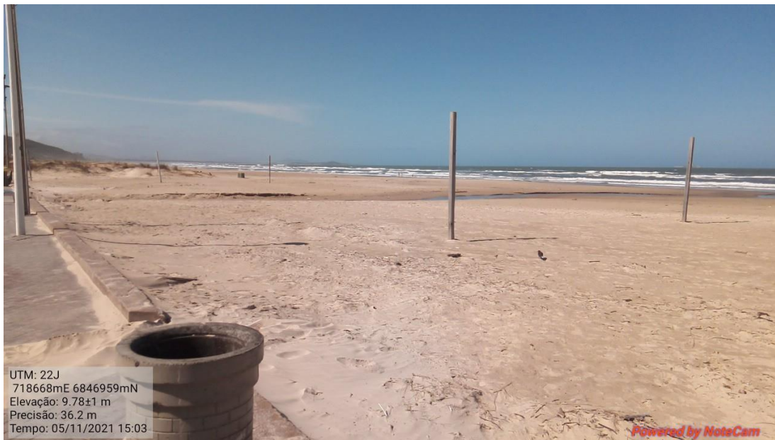
Figura 5: Vista parcial da área de intervenção com destaque para os elementos de infraestrutura urbana existentes.

e palanques de madeira específicos para prática de esportes (Figuras 5 e 6, fotos da vistoria na data de 05/11/2021).