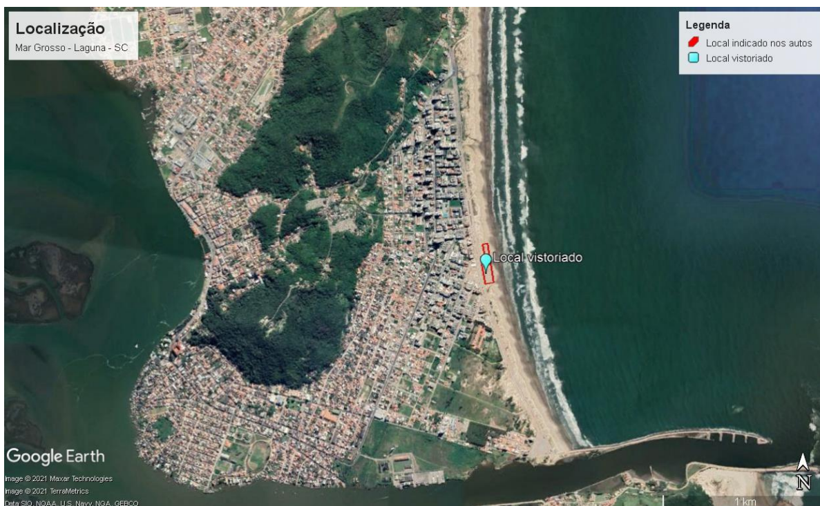
Figura 2: Localização da área em relação ao bairro Mar Grosso.