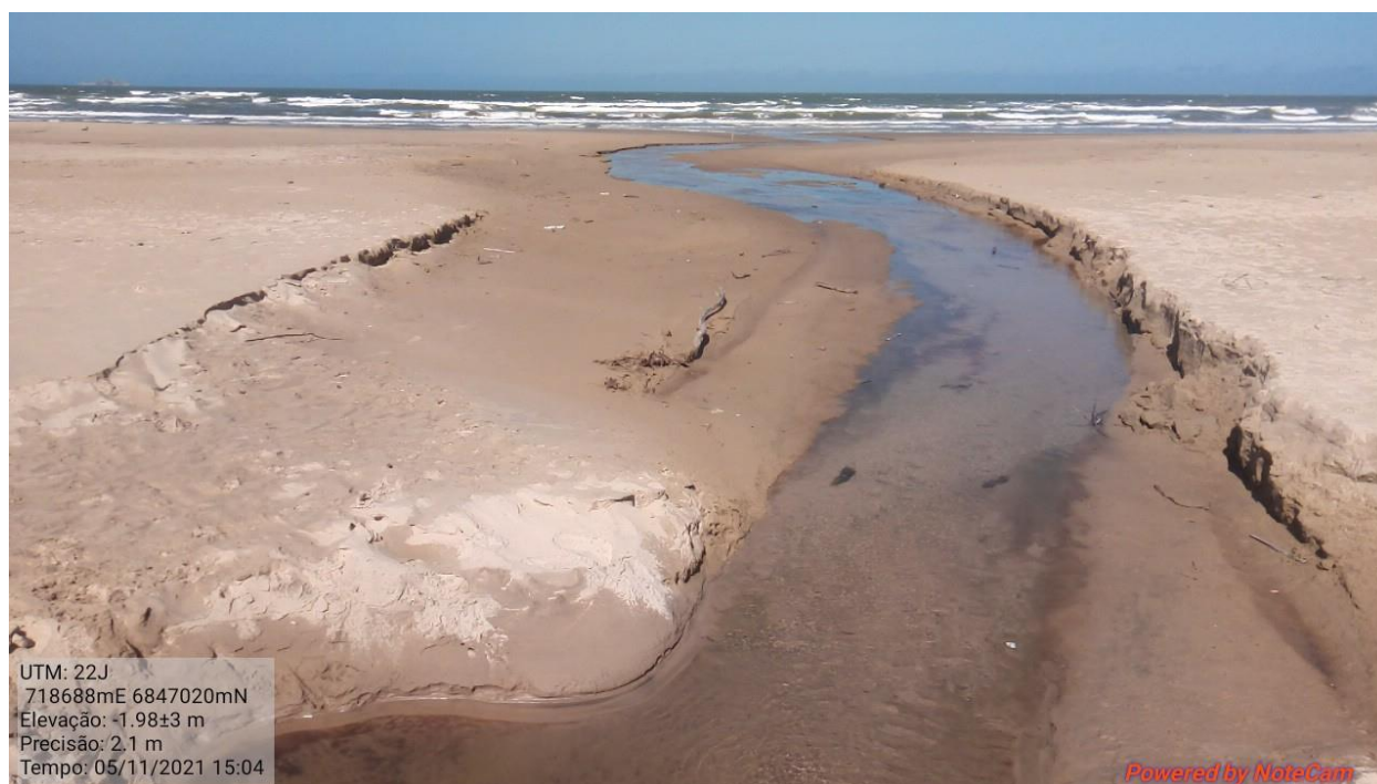
Figura 7: Vista parcial da área de intervenção com destaque para o curso hídrico artificial que deságua no mar.

6.9.3. Há um curso hídrico artificial localizado aproximadamente no meio da área indicada, o qual surge a partir de manilhas de concreto que canalizam as águas da rede de drenagem pluvial e que culmina no mar (Figura 7). Apesar de não representar um curso hídrico natural verificou-se no local que o mesmo serve como habitat de espécies de fauna, assim como o aspecto da água na data da vistoria (2021 e 2022) estava límpido e havia fluxo considerável de água. Entende-se que as intervenções previstas não devem obliterar totalmente tal curso.